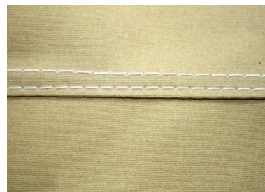
Result / Ergebnis